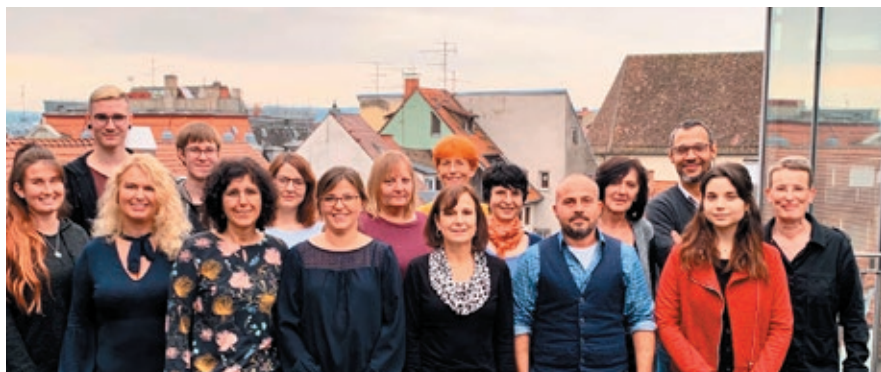
Das Team der Stadtbibliothek heißt Sie herzlich willkommen!